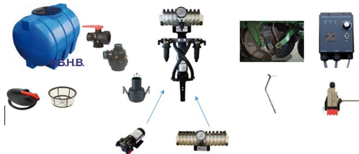
Схема комплектації системи ручного керування «GX1-MAN-X»

Дана система спеціально спроектована під внесення рідких комплексних добрив і здатна задовольнити будь-якого сільгоспвиробника Дана система – просте, довговічне і дуже ефективне рішення для невеликих сівалок, основні переваги: