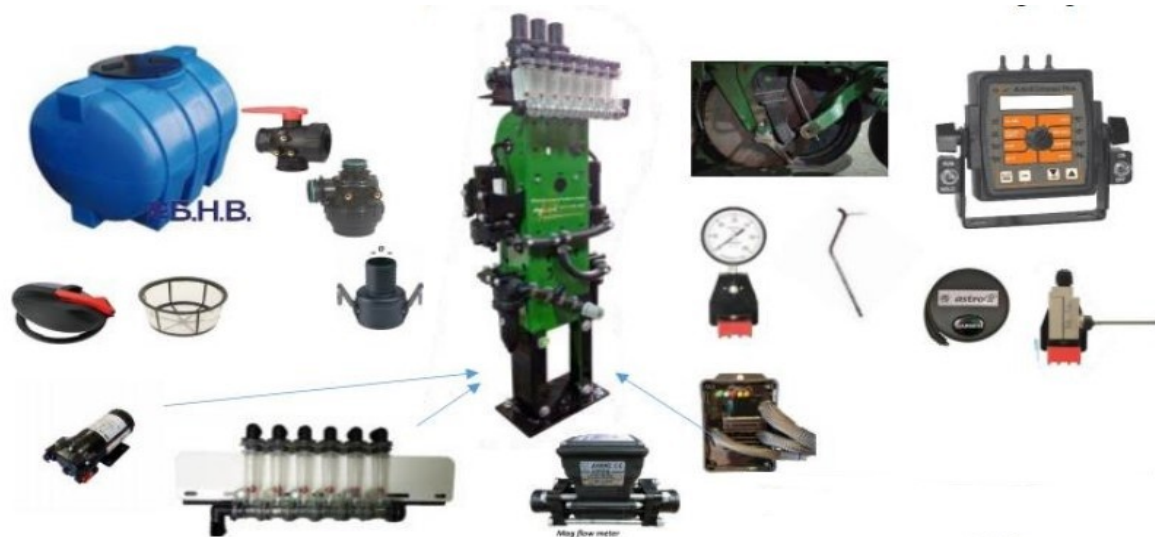
Схема комплектації системи автоматичного керування «GX1-AutoX»